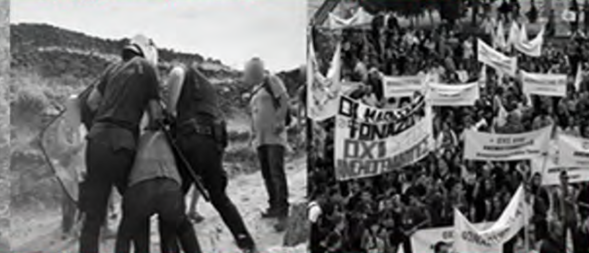
ΜΑΤΙ ρίχνουν ξύλο σε διαδηλωτή στην Τήνο