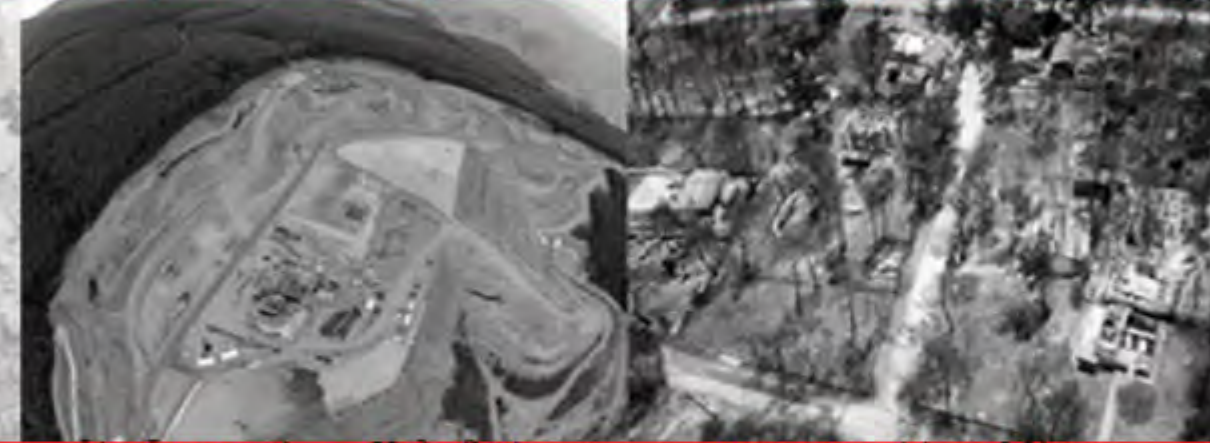
εξόρυξη χρυσού στην Χαλκιδική