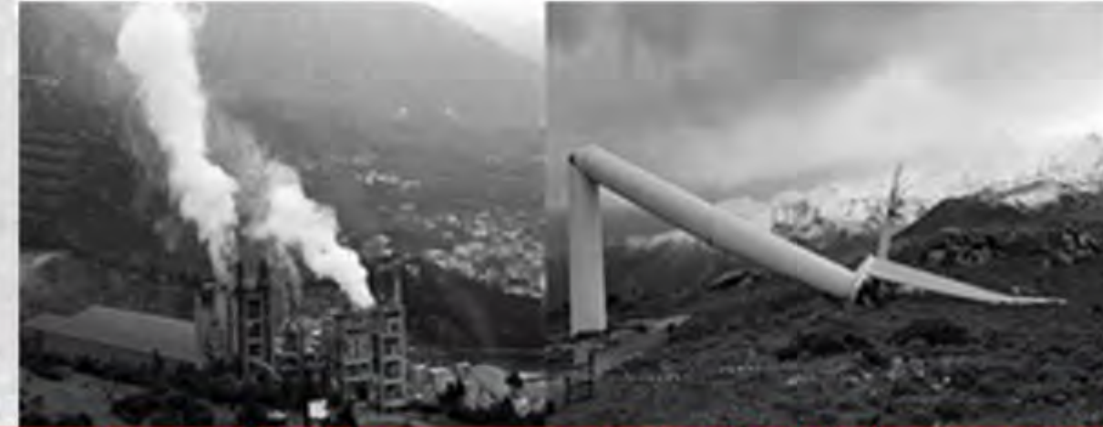
καύση σκουπιδιών, Βόλος